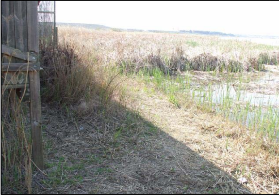
Vista de la zona de acceso al lago (junto observatorio aves) en 2007