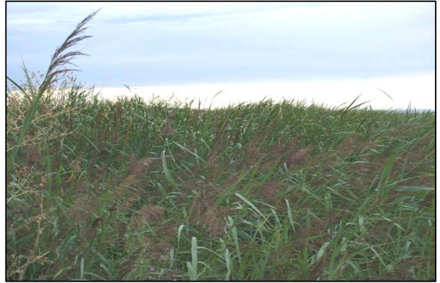
Vista de la zona litoral del lago, recubierta de Phragmites sp.