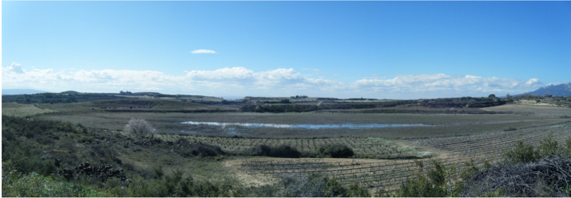
Panorámica de la laguna.