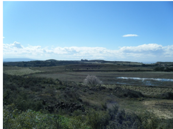
Vista de la zona sin agua.