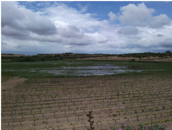
Vista de la zona encharcada y de los cultivos circundantes.