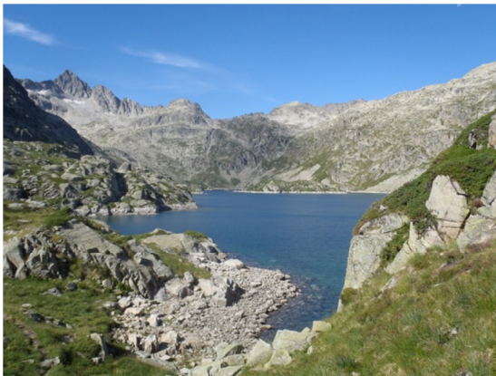
Vista del lago