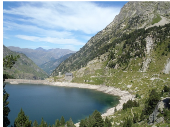
Vista del embalse de La Restanca con el refugio y la presa al fondo, puede observarse también el bajo nivel del embalse