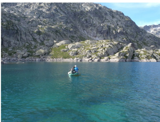
Imagen de la toma de datos y muestras desde la embarcación