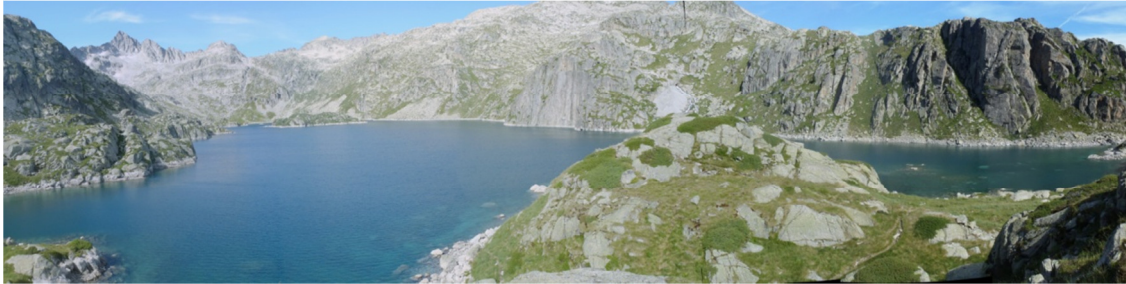
Vista panorámica del lago